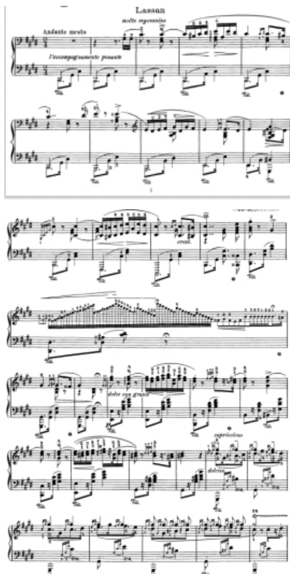
Gambar 5. Bagian pertama adalah lassan .