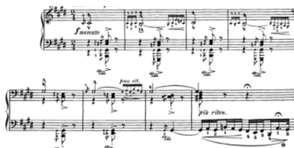
Gambar 4. Bagian Pengantar dimulai dengan gerakan lento a capriccio

Dimulai dari bagian lassan , dengan pengantar singkatnya. Meskipun dimulai pada triad mayor C-sharp, C-sharp minor segera ditetapkan sebagai kunci utama. Dari titik ini, komposer memodulasi secara bebas, terutama pada tingkat 1 (tonika) mayor dan mayor relatif. Gambaran suasana hati lassan umumnya gelap dan melankolis, meskipun mengandung beberapa momen lucu dan berubah-ubah. Bagian Lassan dimulai, dengan tempo atau gerakan lambat, tidak teratur, tetapi berkembang perlahan. Perlu diperhatikan teknik virtuoso sudah berjalan pada bagian ini. Bagian pertama dari tema pokok berpindah ke tingkat