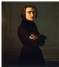
Gambar 1. Franz-Liszt