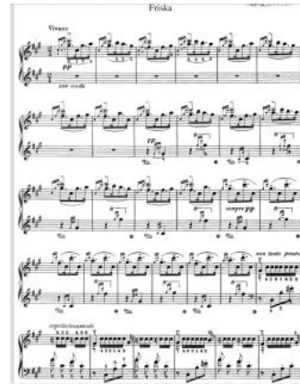
Gambar 4.1.3. Bagian ini adalah Friska

Dimulai dari bagian kedua, friska . Ini terbuka dengan tenang di kunci/akor F-sharp minor (fis minor), tetapi pada kunci dominannya, C-sharp major (cis mayor), mengingat tema dari lassan . Progresi harmoni dominan dan tonika yang bergantian dengan cepat meningkatkan volume/dinamik, tempo mendapatkan momentum saat tema utama bagian Friska (dalam mayor F-sharp ). Pada titik ini, bagian Friska memulai perjalanannya dengan energi dan bravura pianistik yang terus meningkat, masih ditopang oleh harmoni tonika dan dominan yang bergantian. Modulasi untuk dominan ( C-sharp mayor ) dan median yang diturunkan ( A mayor ). Saat ketenangan dirasakan permainan pada kunci minor F-tajam , dan diikuti dengan instruksi, Cadenza ad lib . Pada bagian terakhir, di kunci F-sharp mayor (fis mayor), ada peningkatan oktaf prestissimo , yang naik dan turun untuk mencakup hampir seluruh rentang keyboard dan membawa Rhapsody ke kesimpulan (bagian akhir).