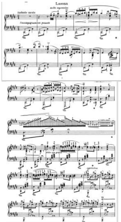
Gambar 4.1.2 Bagian pertama adalah lassan , (sumber gambar: https://www.free-scores.com/download-sheet-music.php?pdf=3657# )

mayor relatif dari kunci dasar) dan membuka register yang lebih tinggi yang akan menjadi tema utama bagian friska, dan mulai membangun dan berakselerasi di parralel tonic major (Cis mayor). Register adalah (tingkat nada), merupakan tingkatan ketinggian atau kerendahan dari kelompok nada-nada dari sebuah melodi. Sebuah melodi dapat menempati tingkat nada yang tinggi, sedang, atau rendah. Dalam komposisi yang ada melodi yang sama bisa bergeser dari tingkat nada yang satu ke tingkat nada lainnya. Kemudian kembali ke tema awal dengan tempo lambat, tema lassan utama kembali diulang, dihias, dan intro kembali diperdengarkan untuk terakhir kalinya dalam bentuk yang dimodifikasi, dan menuju ke bagian 3, yaitu Friska.