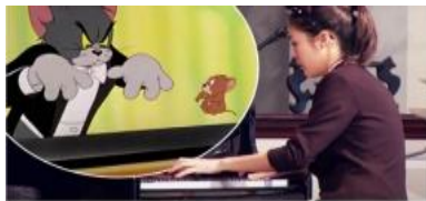
Gambar 3. : Yanni Tan, seorang pianis virtuoso.