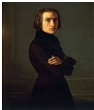
Gambar 1. Franz-Liszt