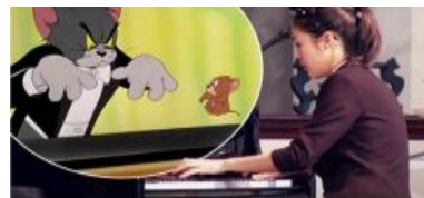
Gambar 3. : Yannie Tan, seorang pianis virtuoso.