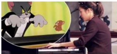
Gambar 3. : Yanni Tan, seorang pianis virtuoso.