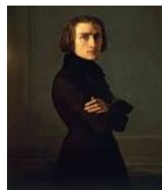
Gambar 1. Franz-Liszt

Franz Liszt menerima pelajaran piano dari ayahnya sejak usia dini. Menunjukkan minat pada musik gereja dan folk, Liszt mulai mengarang musik pada usia delapan tahun, memberikan konser publik pertamanya pada usia sembilan tahun. Terkesan dengan permainannya, raja-raja Hongaria mendanai pendidikan musiknya di Wina selama enam tahun berikutnya. Franz Liszt adalah ahli piano terhebat pada masanya. Dia adalah orang pertama yang memberikan resital solo lengkap sebagai pianis. Dia adalah seorang komposer dengan orisinalitas yang luar biasa, mengembangkan bahasa yang harmonis dan mengantisipasi musik atonal abad ke-20. Dia menemukan puisi simfoni untuk orkestra. (sumber; https://delphipages.live/id/hiburan-budaya-pop/musik-klasik/franz-liszt ).