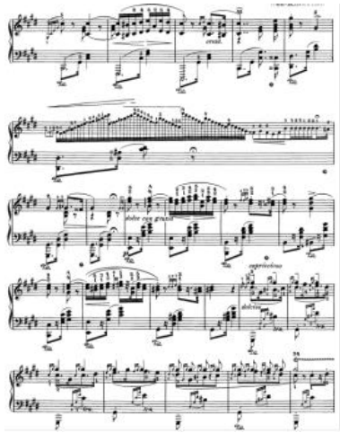
Gambar 4.1.2 Bagian pertama adalah lassan , (sumber gambar: https://www.free-scores.com/download-sheet-music.php?pdf=3657# )