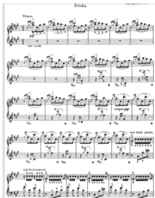
Gambar 6. Bagian ini adalah Friska

Dimulai dari bagian kedua. Ini terbuka dengan tenang di kunci/ akord F-sharp minor (fis minor), tetapi pada kunci dominannya, C-sharp major (cis mayor), mengingat tema dari lassan . Progresi harmoni dominan dan tonika yang bergantian dengan cepat meningkatkan volume/dinamik, tempo mendapatkan momentum saat tema utama bagian Friska (dalam mayor F-sharp ). Pada titik ini, bagian Friska memulai perjalanannya dengan energi dan bravura pianistik yang terus meningkat, masih ditopang oleh harmoni tonika dan dominan yang