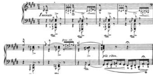
Gambar 4. Bagian Pengantar dimulai dengan gerakan lento a capriccio