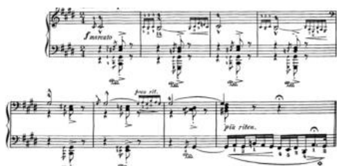
Gambar 4. Bagian Pengantar dimulai dengan gerakan lento a capriccio

Pengantar dimulai dengan gerakan lento a capriccio yang singkat. Lento a capriccio adalah tanda tempo yang menunjukkan pendekatan yang bebas dan berubah-ubah terhadap tempo (dan mungkin gaya) karya tersebut. Pengantar dimaksudkan untuk terdengar hampir tidak terukur, tetapi menggunakan ritme yang diselingi.